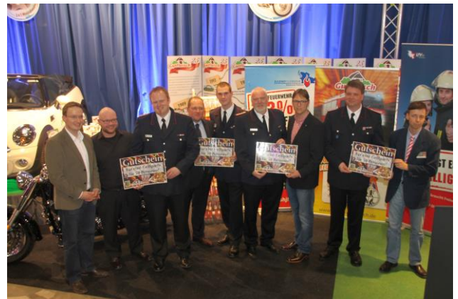
Vier gute Beispiele für gemeinsame Aktionen zwischen Einzelhändlern und Feuerwehr wurden mit je einem Grillfest für 50 Personen belohnt: v.lks. Flintbek, Tornesch, Wedel und Geesthacht.