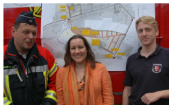
MdL Beate Raudies im Kreis der Feuerwehr in ihrem Wahlkreis.

abgeschickt und steht nun als 100. Teilnehmerin fest. Als feuerwehrpolitische Sprecherin der SPD-Landtagsfraktion ist die Teilnahme am 1. Feuerwehr-Marketing-Kongress für die Landespolitikerin beinahe eine Pflichtveranstaltung. Raudies: „Unsere Freizeit für Ihre Sicherheit!“ – so lautet, kurz gefasst, das Motto der Freiwilligen Feuerwehren. Doch in Stadt und Land wird es schwieriger, Menschen zu finden, die bereit sind, sich dieser Aufgabe zu stellen. Der 1. Feuerwehr-Marketingkongress soll dazu Möglichkeiten aufzeigen und frische Ideen liefern. Die Freiwillige Feuerwehr wirbt um Mitglieder und geht dabei neue Wege – gut! Ich freue mich auf einen spannenden Tag im Landeshaus.“